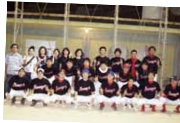
野球・球技サークル

あやはしハーフマラソンや伊江島一周ハーフマラソン、那覇マラソンそしておきなわマラソンと一年を通してさまざまなマラソンにみんなで楽しく参加をしています。