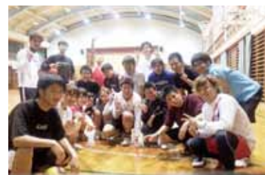
スポーツ全般サークル

初心者から経験者まで大歓迎!! 月3回程度、奥武山サブグラウンドで練習や試合を行っています。 マネージャーもいますので男女関係なくご参加下さい。