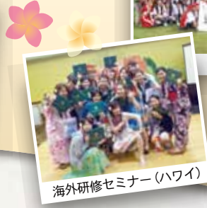
海外研修セミナー(ハワイ)