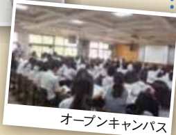
オープンキャンパス