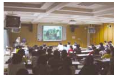
アジア保健医療研究会

音楽のジャンルにこだわらず楽しく活動をしています。それぞれが演奏したい楽器を持ち込んで自由にバンドを組んでいます。看大祭では毎年、ライブ演奏を行っています。