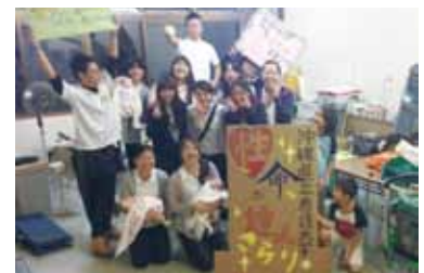
性・命の達人 キラリサークル

私たちは、学生と教員みんなで仲良くなるをモットーに、映画鑑賞・学生と教員の交流会・調理実習・研修の企画(離島・県外)・学生ちゃんぷる～通信の発行等を行っています!