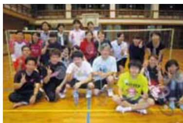
バドミントンサークル

平成22年度から活動しています。妊娠・出産、性感染症、避妊、デートDVなどに関する展示物や体験コーナーを通して、近隣大学や中学校、離島など地域に情報発信するサークル活動を展開しています。