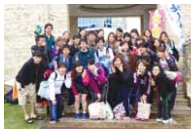
マラソンサークル

主な活動内容は、世界で活躍している専門家による講演会の開催、海外で活躍した学生の報告会などを通して、国際保健医療に関する理解を深めます。