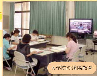
大学院の遠隔教育