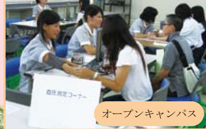
オープンキャンパス