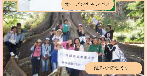
海外研修セミナー