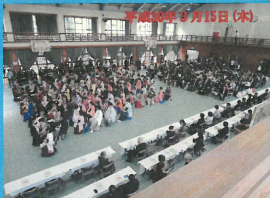
平成30年9月15日(木) 看護学科79名、別科助産専攻21名、大学院9名の学生が、本学を卒業(修了)しました。

第20回 看護学部 入学式 第11回 別科助産専攻 入学式 第15回 大学院 入学式