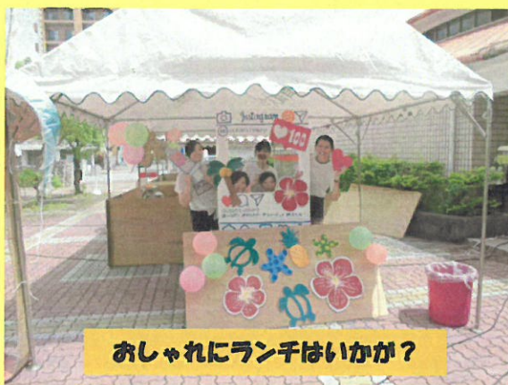
おしゃれにランチはいかが？