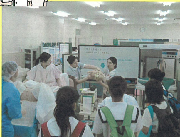
助産師への第一歩♡ 命の誕生