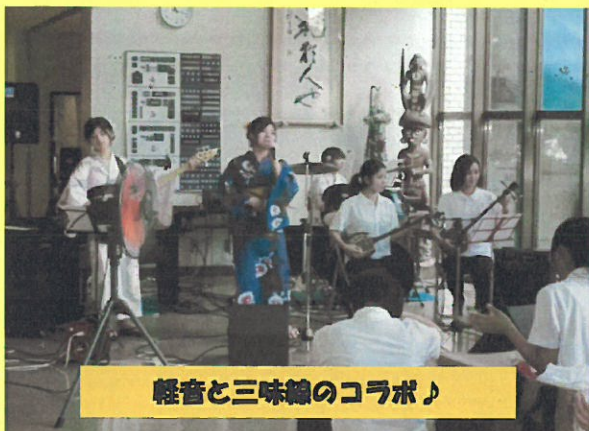
軽音と三味線のコラボ♪