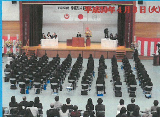
平成30年4月3日(火) 看護学科80名、別科助産専攻20名、大学院8名の学生が、本学に入学しました。