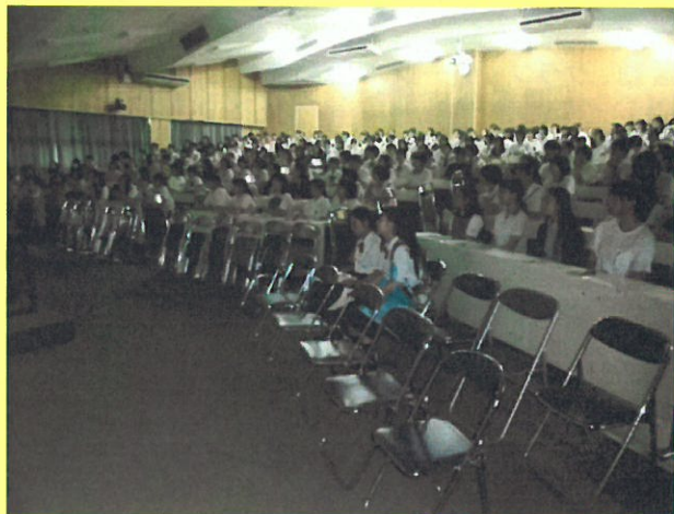
合格めざして 入試説明会☆